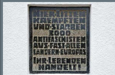
Gedenkbord aan de Boelcke-kazerne