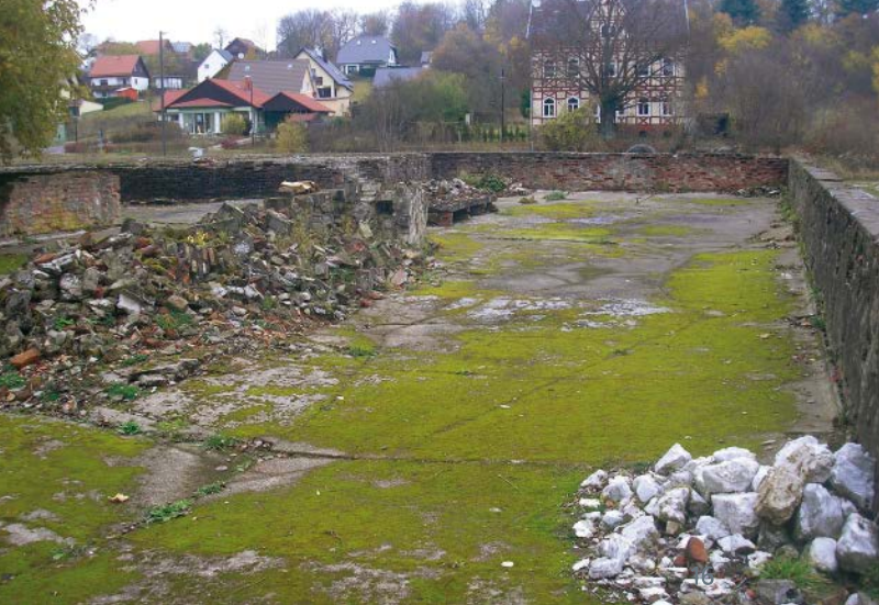
Ruïne van de keukenbarak in het voormalige kamp Ellrich-Juliusshütte

gebouwen en restanten zichtbaar. Informatieborden geven wat toelichtingen over de plaats, gedenkstenen herinneren aan de bijna 4000 doden.