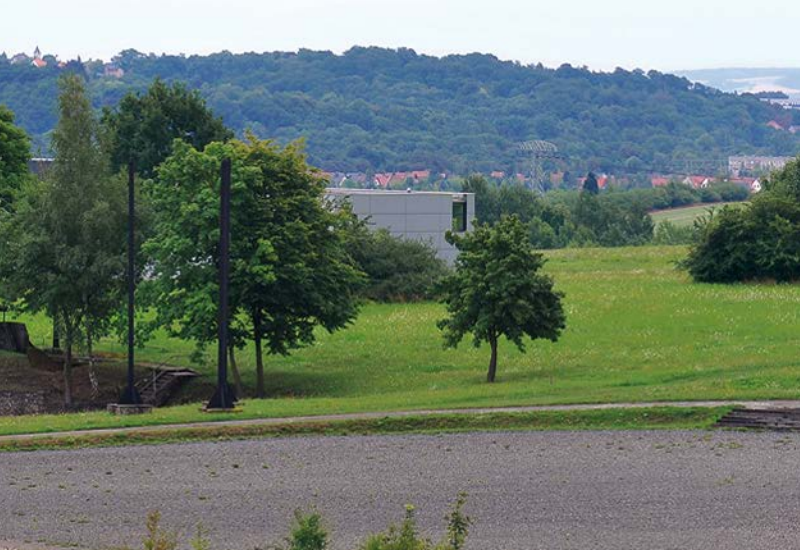
Blik over de voormalige appelplaats en het museum in richting Nordhausen