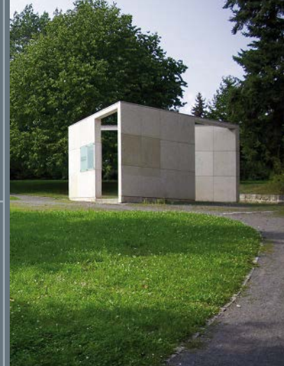
Nordhausen: Erebegraafplaats langs de Streseemannring