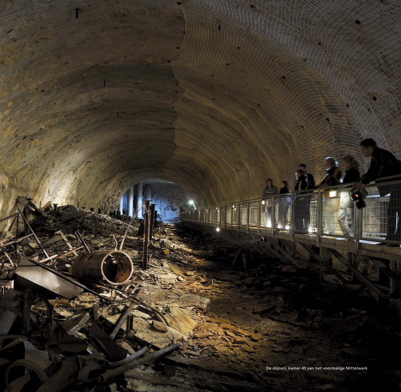
De mijnen, kamer 45 van het voormalige Mittelwerk