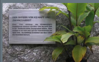
Gedenksteen voor de Heimkehle-grot