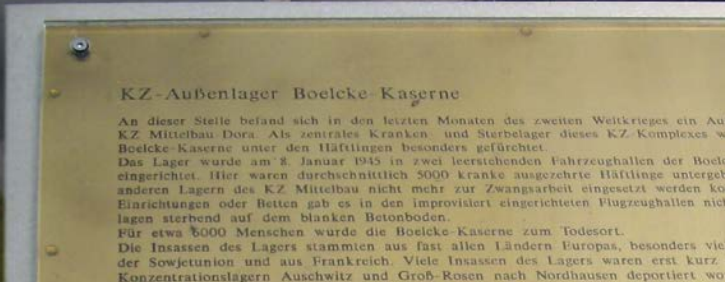
Nordhausen: Voormalige Boelcke-kazerne langs de Rothenburgstraße