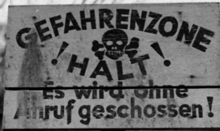
Waarschuwbord van de SS bij het hek van het buitenkamp