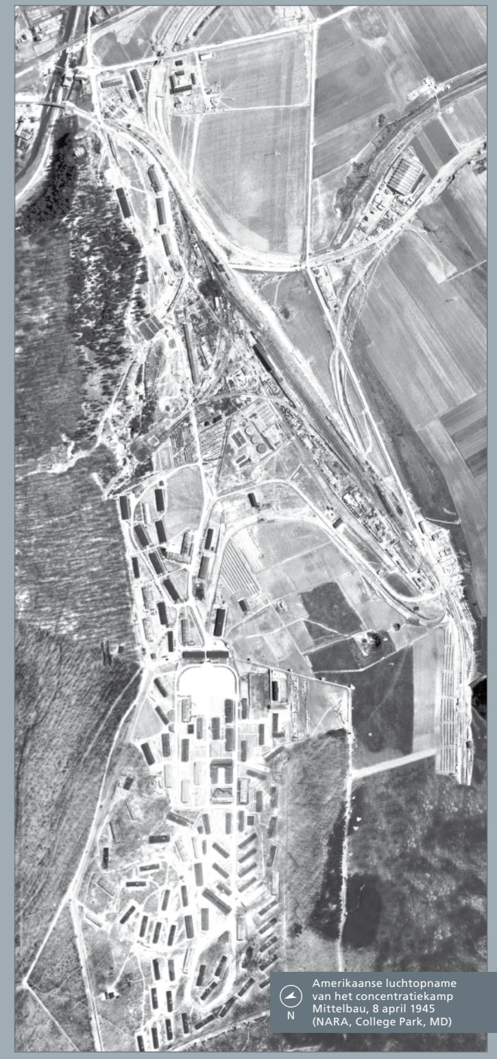
Amerikaanse luchtopname van het concentratiekamp Mittelbau, 8 april 1945

Stiftung Gedenkstätten Buchenwald und Mittelbau-Dora