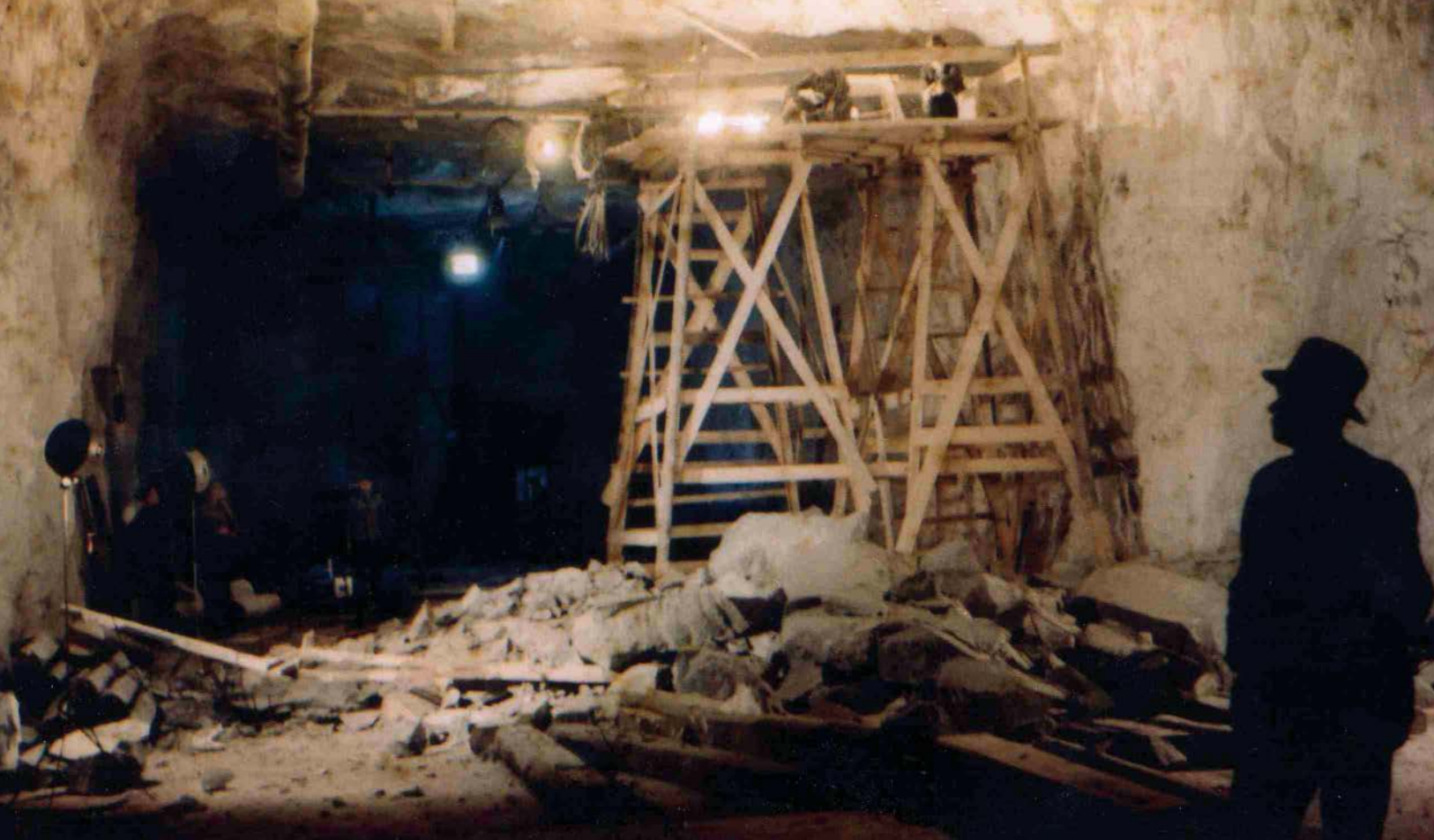
Uitbreiding van de mijngangen in de berg Kohnstein, zomer 1944.